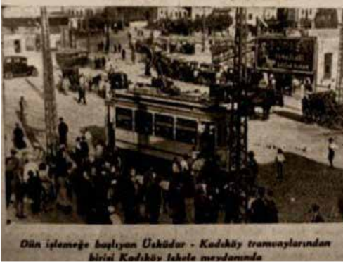
Dün işleme başlanan Üsküdar - Kadıköy tramvaylarından birisi Kadıköy İskelesi'nde

Üsküdar - Kadıköy seferleri dün başladı, Bostancı hattı ay sonunda bitecek