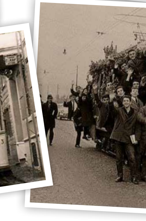
Tramvayların kâra geçtiğini gören yetkililer, ilerleyen dönemlerde Bostancı, Moda, Feneryolu hatlarını açmış.