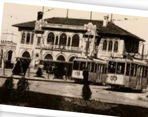
Mavralarla Kadıköy'e taşınan tramvaylar