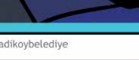
Tramvayların kâra geçtiğini gören yetkililer, ilerleyen dönemlerde Bostancı, Moda, Feneryolu hatlarını açmış.